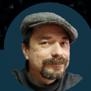
X. Dositeo Veiga

Geert Barentsen & Jorick Vink (Armagh Observatory) & the IPHAS Collaboration Título: Monstros de IC 1396 Primeira foto publicada no www.apodgalego.com o 25 de abril de 2011